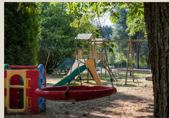
Appartamenti immersi in un Demanio tipico delle Ardenne, dove il tempo lascia spazio al relax senza pensieri